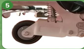
5 Quinta rueda de dirección