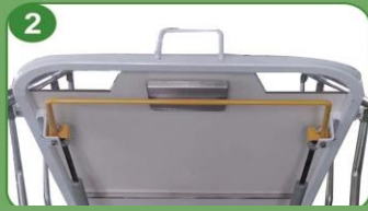
2 Respaldo con resorte de gas (Dos filas de resortes de gas)