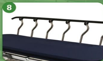
8 Barandales laterales de diseño curvo