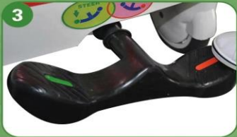
3 Sistema de cierre centralizado (Equipado en la cabecera y los pies de la cama)