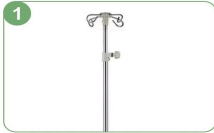
Poste de acero inoxidable