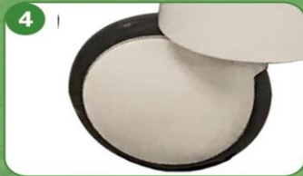
4 Ruedas a prueba de polvo de 200 mm de diámetro