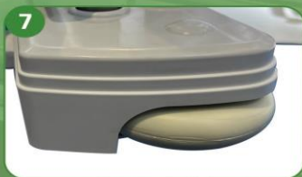
7 4 Ruedas de ABS (anticolisión)