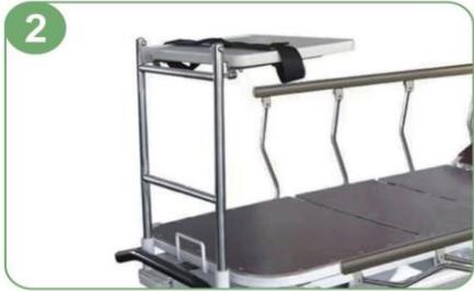
Soporte para desfibrilador (opcional)