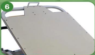
6 Sección posterior translúcida de rayos X (Con una manivela se mueve la cabecera)