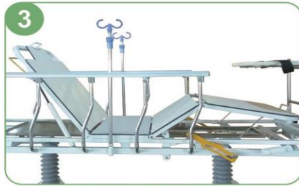
Superficie translúcida de rayos X de longitud completa