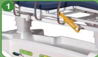
1 Dos cilindros hidráulicos (Protección antipolvo telescópica plegable de goma)