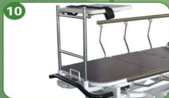
10 Soporte para desfibrilador