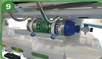
9 Soporte para cilindro de oxígeno de 16 cm y espacio de almacenamiento.